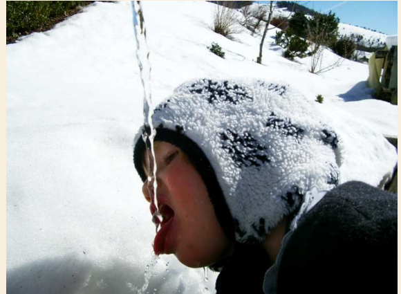
Die frühere Brauereiquelle vom „Bierhaus“ speist heute den Großteil der Bernauer Wasserversorgung.

Die wesentlichen Umweltaspekte der einzelnen im Hotel relevanten Prozesse bzw. Tätigkeiten und die dazugehörigen direkten und indirekten Umweltauswirkungen werden von der Geschäftsleitung mit Hilfe von Dr. Sven Eckardt ermittelt, diskutiert und bewertet. Einmal pro Jahr findet außerdem ein internes Audit und eine Managementbetrachtung statt.